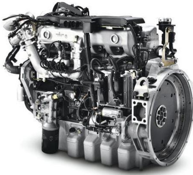
Figura 2 – Motor E0836